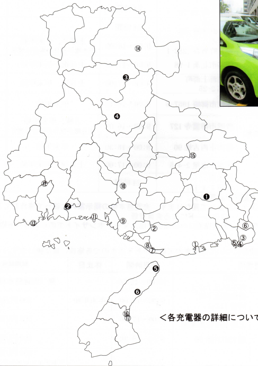
〈兵庫県本庁舎設置充電器〉