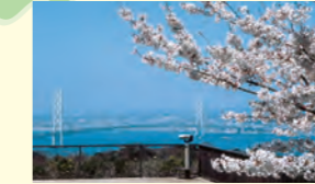
展望広場 明石海峡大橋から大阪湾までが望めます。