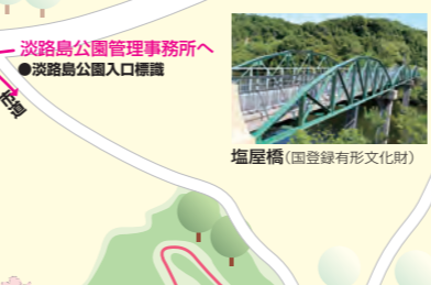
塩屋橋(国登録有形文化財)