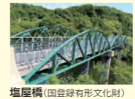
塩屋橋(国登録有形文化財)