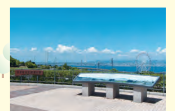
ハイウェイオアシスから明石海峡大橋