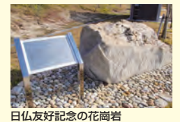
日仏友好記念の花崗岩

大きな芝生広場から交流橋を渡って、ヤマザクラの並木道を抜けていくと、そこは草原と花のエリア。まるでみどりの絨毯のような約8000㎡の芝生広場、明石海峡大橋や淡路島公園全景が見渡せる展望デッキ、日仏友好記念の約20億年前の花崗岩などがあります。