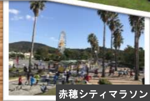
赤穂シティマラソン

・公園は不特定多数の人が自由に利用できるもので、通常は貸切った利用はできませんが、赤穂海浜公園では事前に届出や許可申請をすれば、場所を貸切りにしてイベントを実施することができます。 ・イベントを開催したことがない方でも申込みのお手伝いをしますので、ご応募ください。