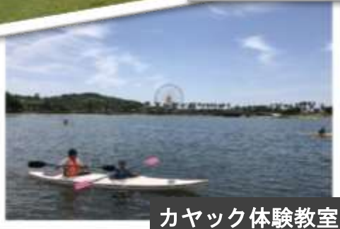
カヤック体験教室