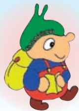
北播磨キャラクター 北歩(ほっぽ)くん