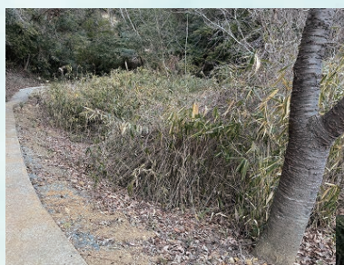
背丈ほどの笹が密集・・・

次回は春頃、経過を観察する予定です ご興味のある方は・・・☎0799-72-5377（管理事務所）まで