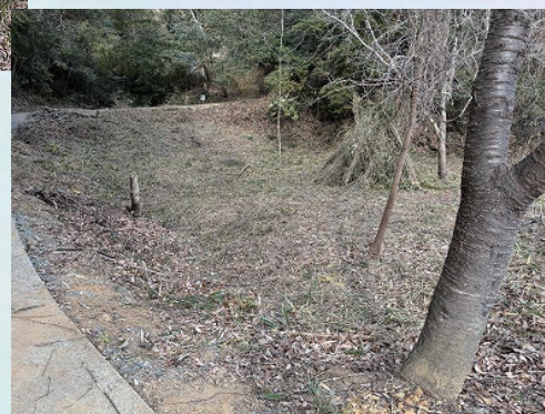
きれいに笹刈りされた後。 意外に広く段差あり。棚田だった名残