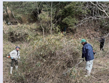
笹刈り機械隊出動！

一般コース上り入口右手側の笹藪だったエリア。開園当時は湿性環境がわずかに残っていました。雪がちらつくほどの寒さの中、たんぼ復活プロジェクトの第一歩としての笹刈り。今までわからなかった地形が確認でき、かすかな水路跡もみつかりました。今後も第二弾、第三弾と保全活動を継続していきたいと考えています