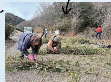
刈った笹をシュロ縄で束ね・・・

束ねた笹は重ねて立てかけて円錐状に。笹でできたカマクラ風。あったかいよ～。生き物の棲み家になったらいいな。